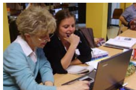
Plus d'infos sur www.pme3000.be